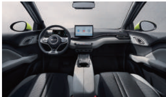
Black and grey