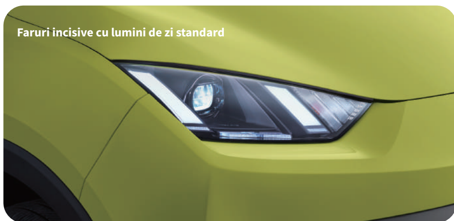
Faruri incisive cu lumini de zi standard