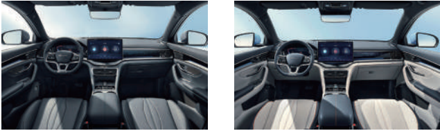
Black Blue & grey